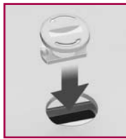
Chiave di bloccaggio per il piatto Locking nut